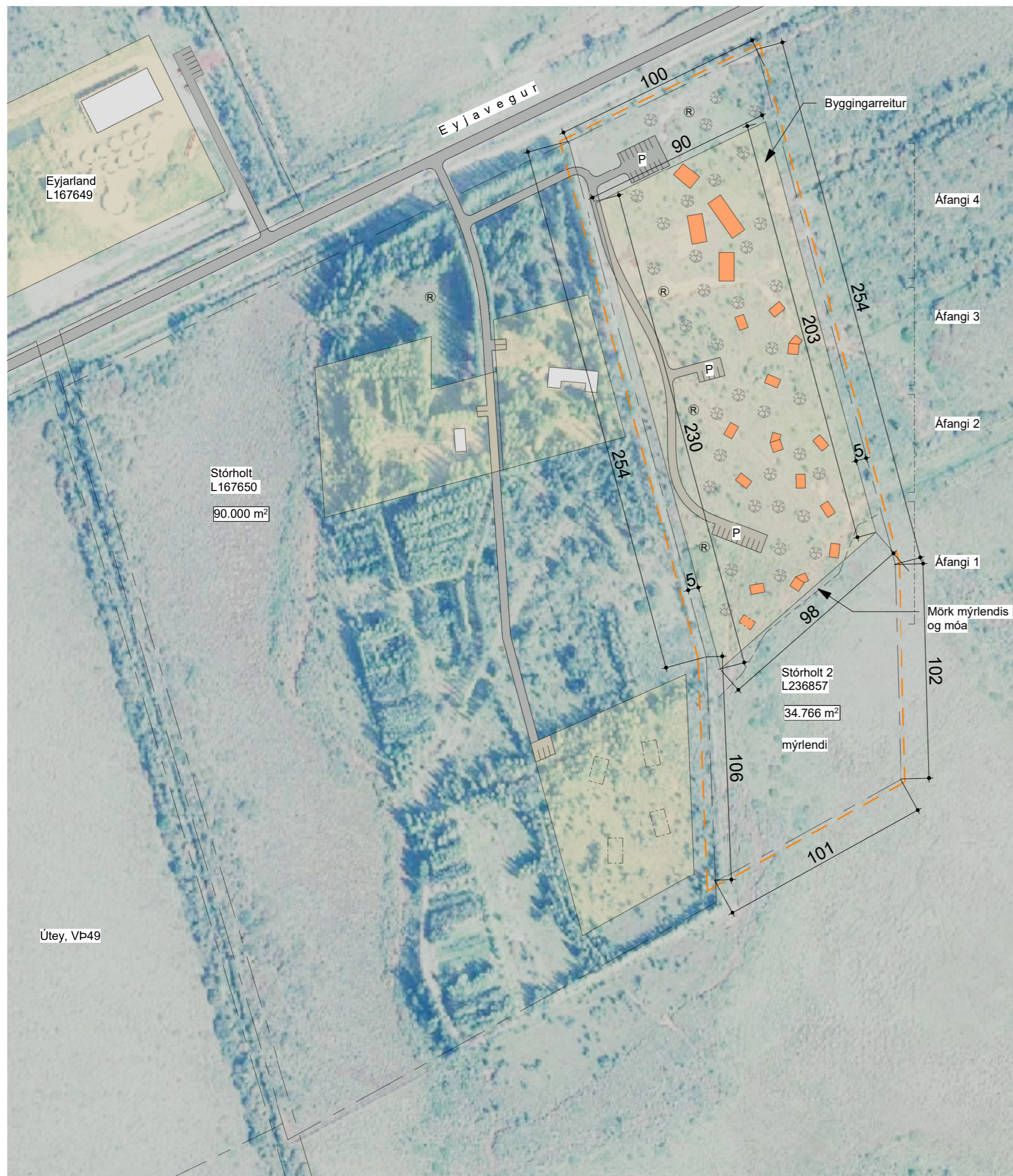
Deiliskipulagsuppráttur - mkv. 1 : 2000