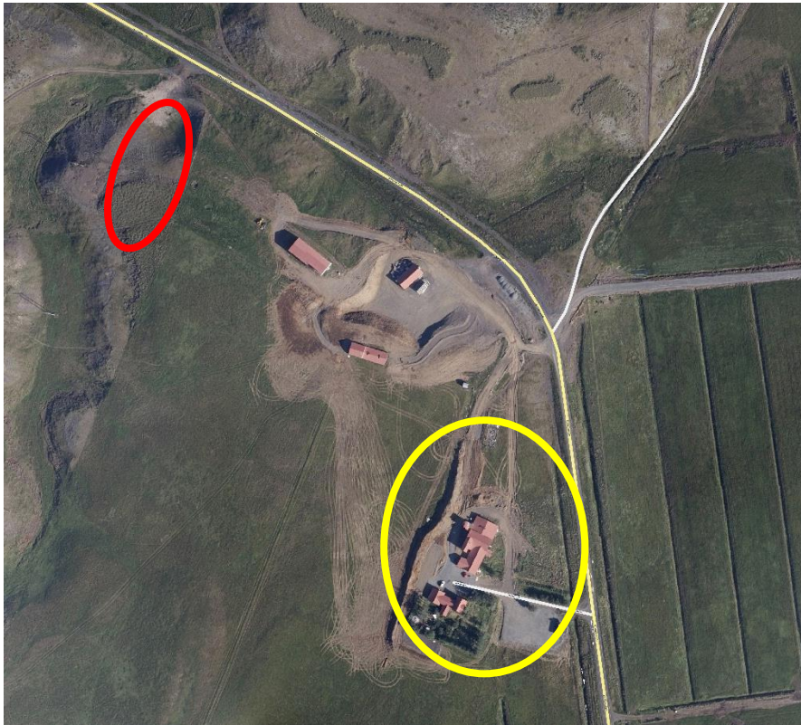
Loftmynd af skipulagssvæði, fyrirhugað verslunar- og þjónustusvæði sýnt með gulri línu og efnistökusvæði með rauðri línu.

Hefðbundinn landbúnaður hefur ekki verið stundaður á Torfastöðum 1 undanfarin ár. Þess í stað hefur verið byggð upp heimagisting og heilsutengd ferðapjónusta í núverandi íbúðarhúsi. Fyrirhugað er að gera við og endurnýja að hluta eldri útihús til að fjölga gistirýmum og stöðrymum fyrir þjónustu við gesti. Nýtt efnistökusvæði er innan jarðarmarka Torfastaða 1 og verður nýtt til þess að sækja efni fyrir jarðvegsmótun tengt fyrrnefndri endurgerð á útihúsum og stíga-/vegagerð ásamt undirstöðum á frístundasvæði F-21 austan við Torfastaði 1 (Bakkahverfi).