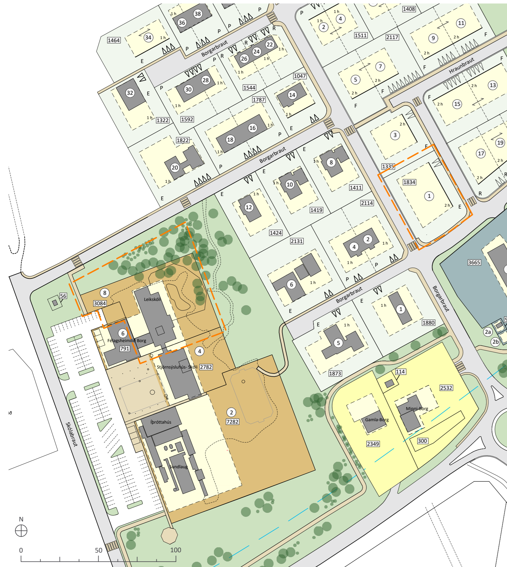
GILDANDI DEILISKIPULAGSUPPRÁTTUR MKV. 1:1.500