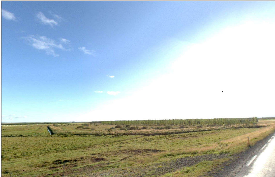
Mynd 1 - Skipulagssvæðið séð frá Skeiða og Hrunamannavegi.

Jörðin Reykir (L166491) stendur við vegamót Skálholtsvegur og Skeiða- og Hrunamannavegar, 17km frá Hringveginum. Reiturinn sem breytingartillaga þessi fjallar um er austar í landinu og liggur að Sandlæk, sem markar jarðamörk milli Reykja og Sandlækjar 1 land 7 (L219035). Vistkerfið einkennist af uppgræddum melum með lággróðri og stöku víðirunna.