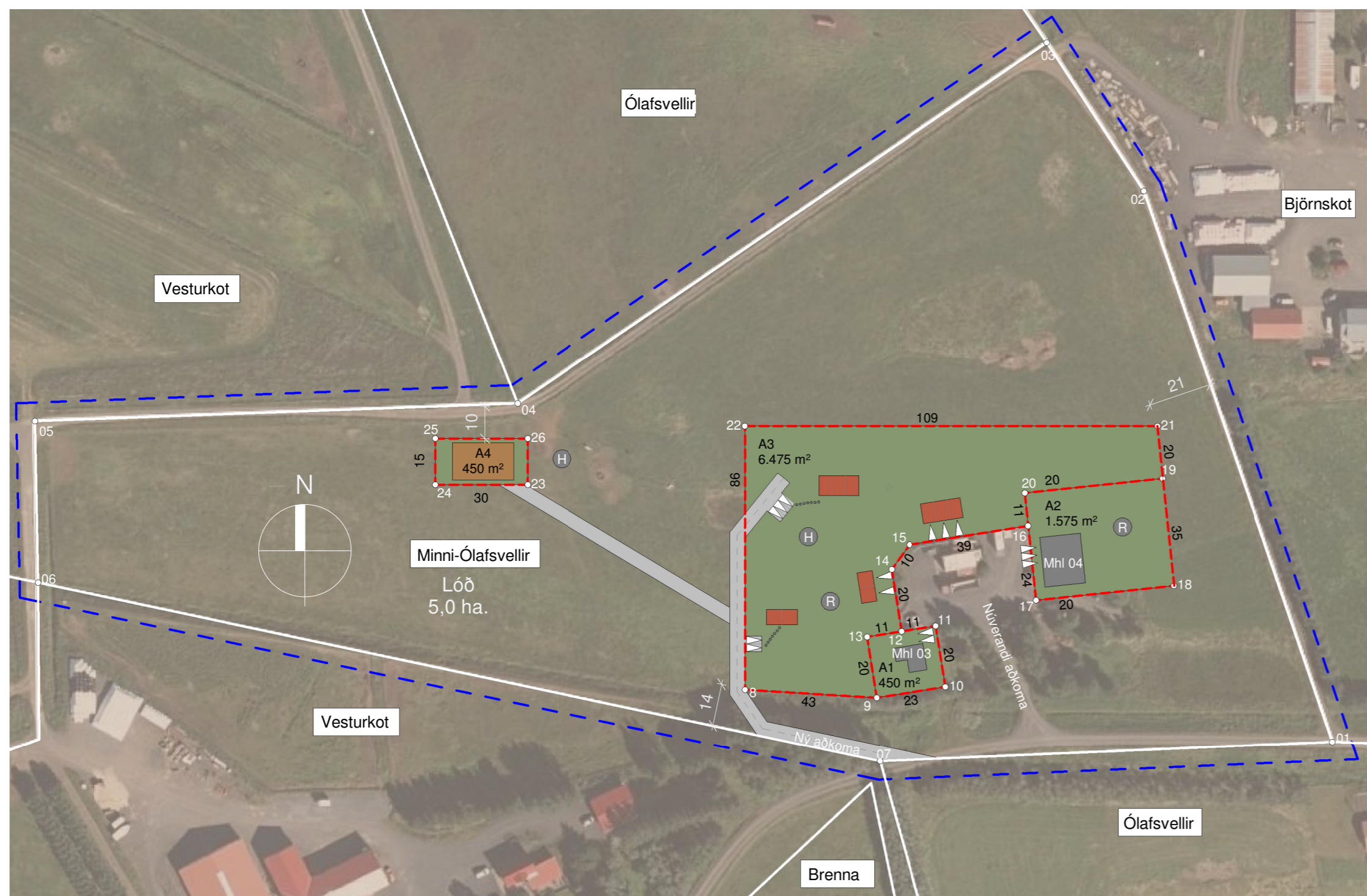
Deiliskipulagsbreyting 1 : 1500