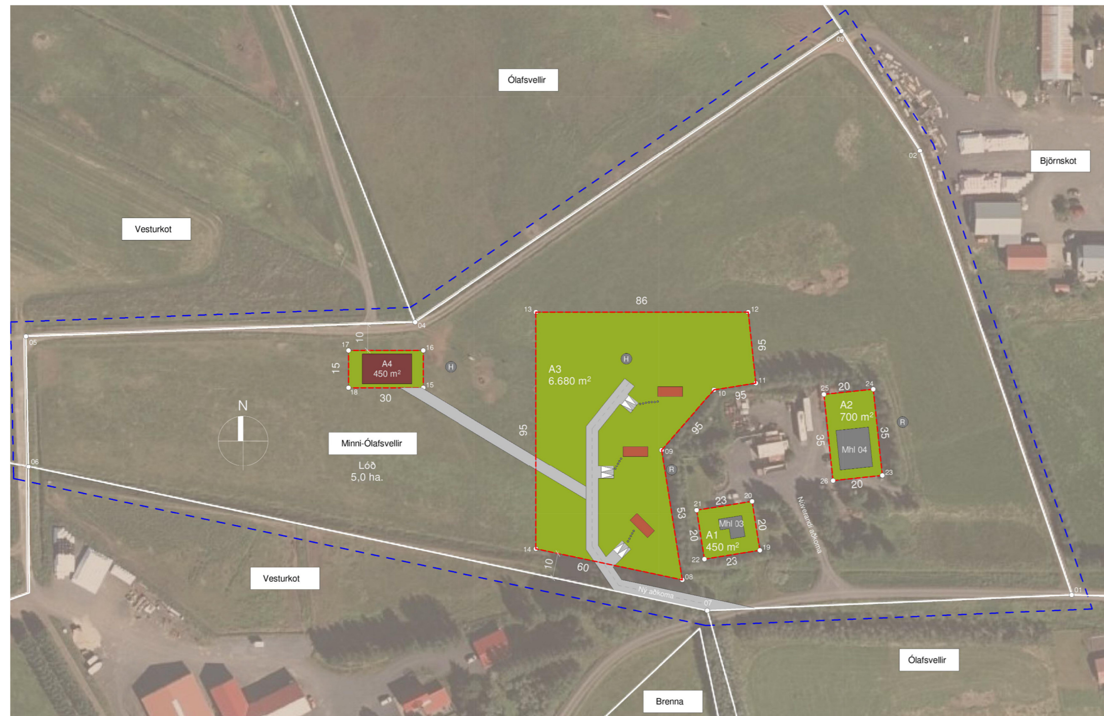
Núverandi deiliskipulag: Samþykkt í sveitarstjórn þann 06.09.23