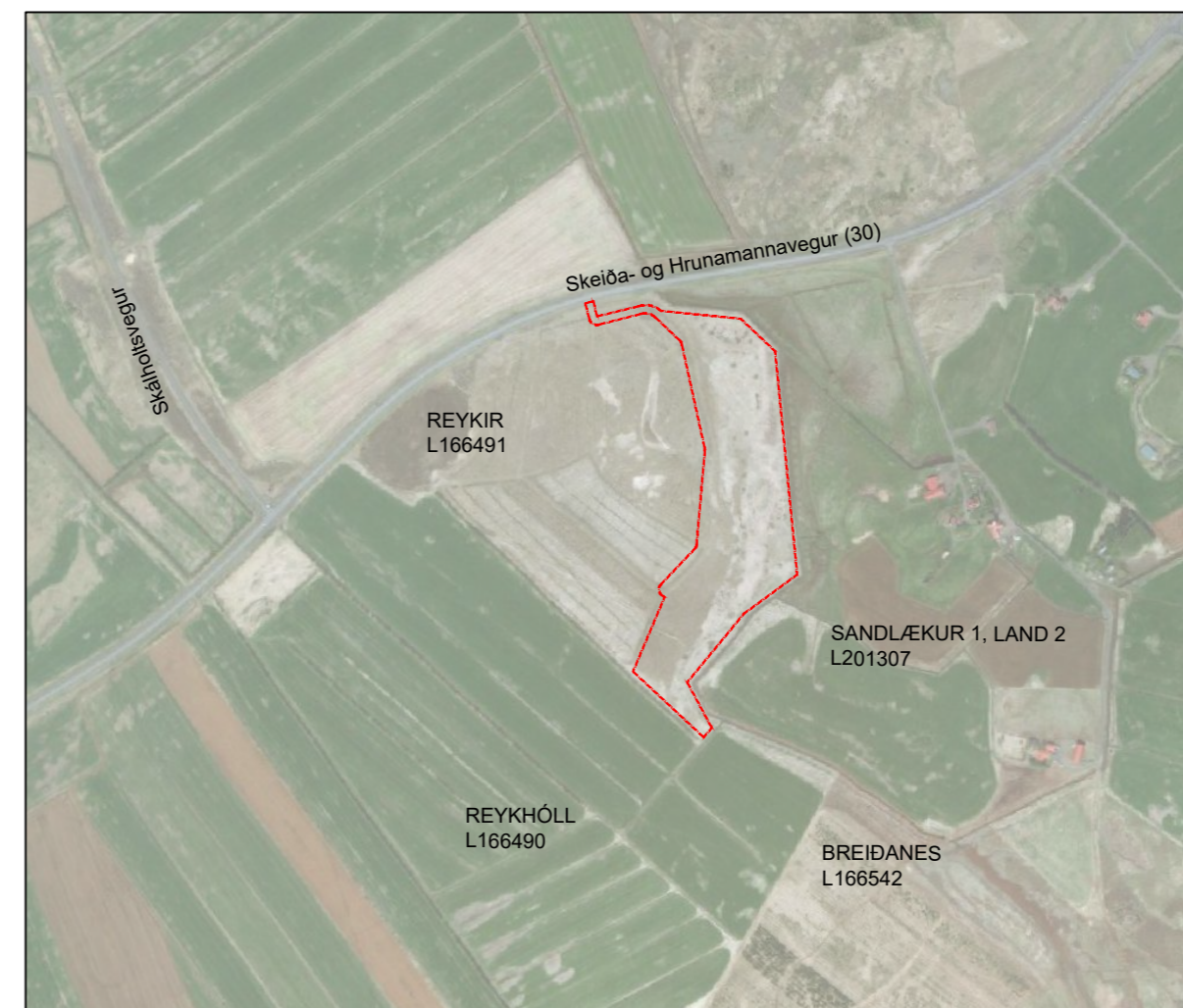
Afstöðumynd. Mkv.: 10.000

Við breytingu á aðalskipulagi, sem var unnin í aðdraganda deiliskipulags þessa, voru umhverfisáhrif metin, svo sem Landslag og ósýnd lands, Menningarmínjar, Náttúrumínjar, Heilsa og öryggi, Byggð og efnisleg verðmæti, Útivist og Fuglalíf. Áhrif á samfélag voru metin jákvæð og áhrif á vistkerfi nokkur, en hvorki jákvæð né neikvæð.