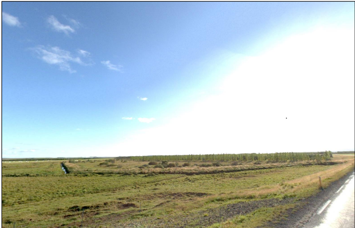
Mynd 1 - Skipulagssvæðið séð frá Skeiða og Hrunamannavegi.

Jörðin Reykir (L166491) stendur við vegamót Skálholtsvegjar og Skeiða- og Hrunamannavegar, 17km frá Hringveginum. Reiturinn sem breytingartillaga þessi fjallar um er austar í landinu og liggur að Sandlæk, sem markar jarðamörk milli Reykja og Sandlækjar 1 land 7 (L219035). Vistkerfið einkennist af uppgræddum melum með lággróðri og stöku víðirunna.