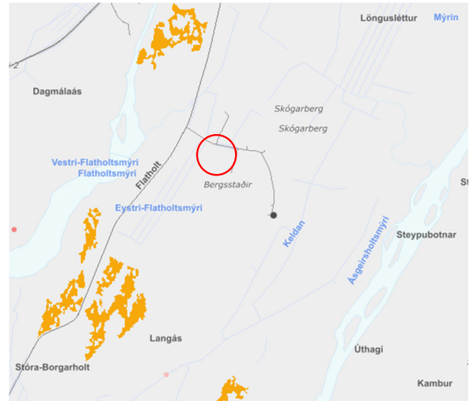
Mynd 2 Sérstök vernd viskerfa og jarðminja, NÍ.