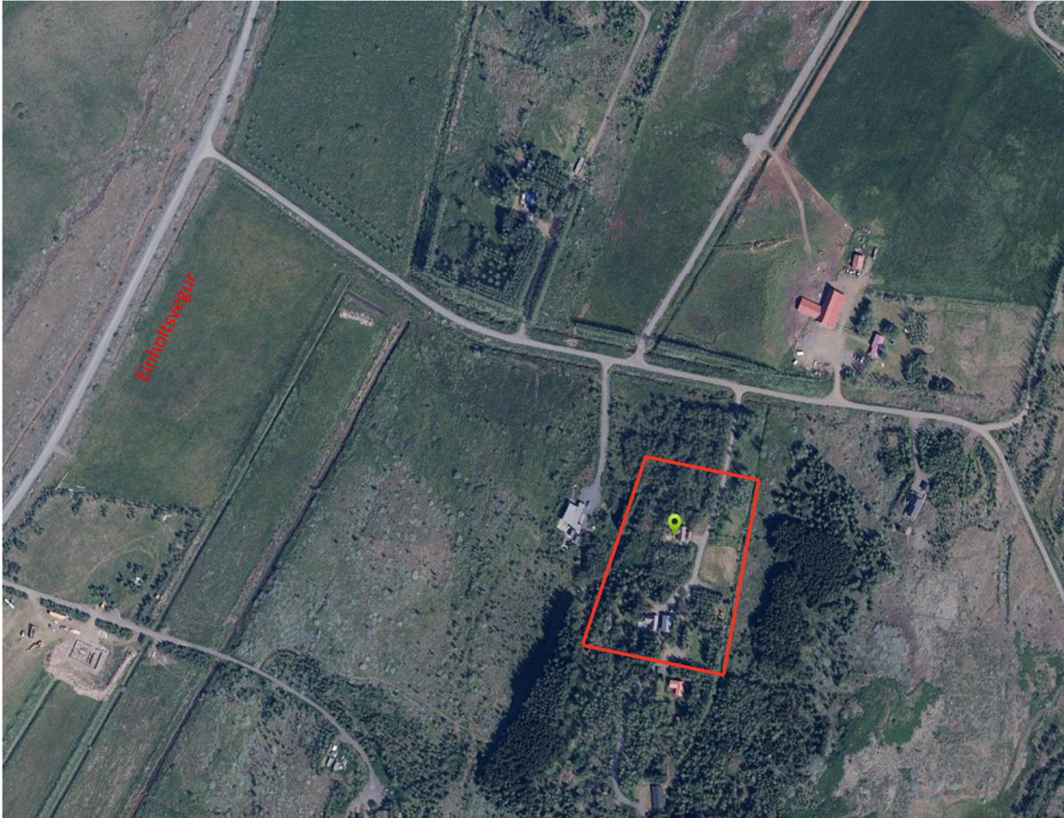
Mynd 1 Skipulagssvæðið / Bergsstaðir lóð 2 er innan rauða rammans

Bergsstaðir liggja milli Tungufljóts og Hvítár, um 9 km aksturfjarlægð norðaustur frá Reykholti og 11 km norður af Flúðum. Aðkoma er frá Einholtsvegi (nr. 358). Lóðin er skráð 12.400 m 2 samkvæmt fasteignaskrá HMS.