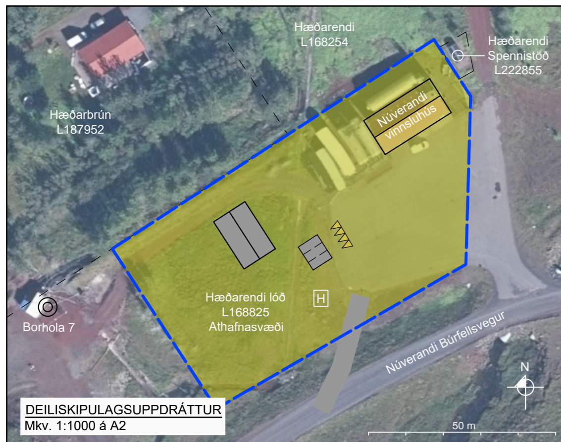
DEILISKIPULAGSUPPRÁTTUR Mkv. 1:1000 á A2