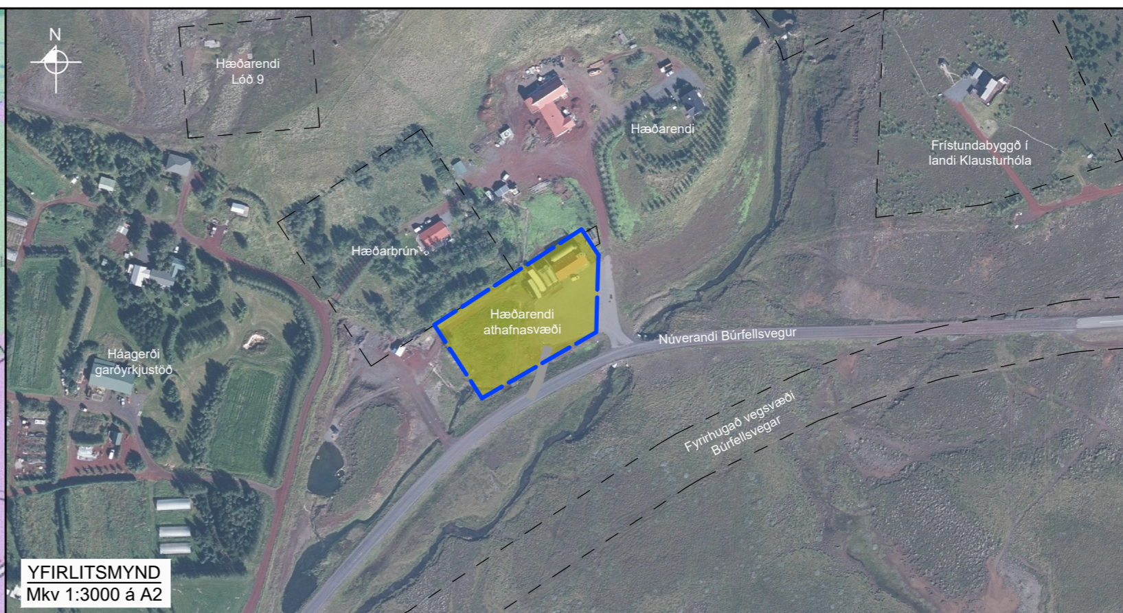
YFIRLITSMYND Mkv 1:3000 á A2

Deiliskipulag þetta sem auglýst hefur verið skv. 1. mgr 41. gr. Skipulagslaga nr. 123/2010 m.s.br. frá _____ til _____ var samþykkt í sveitastjórn Grímsnes- og Grafningshrepps þann _____