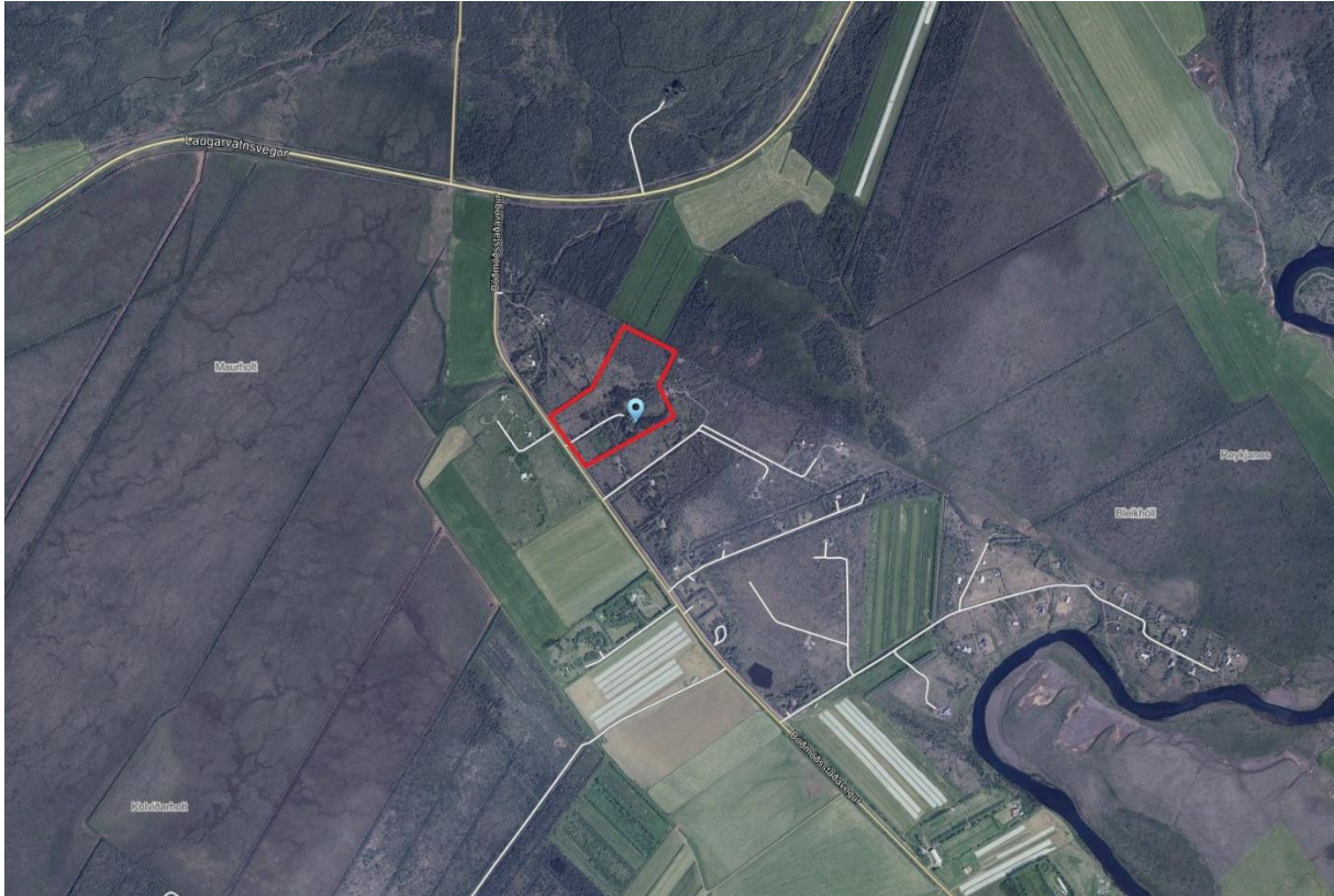
MYND 1. Skipulagssvæðið er innan rauða rammans.