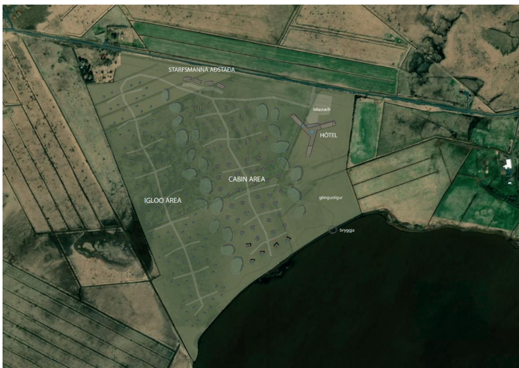
Mynd 2 Yfirlitsmynd af fyrirhugðu skipulagssvæði, frumdrög af mögulegri uppbyggingu.

Heildar byggingarmagn skipulagssvæðis verður allt að 35.000 m 2 .