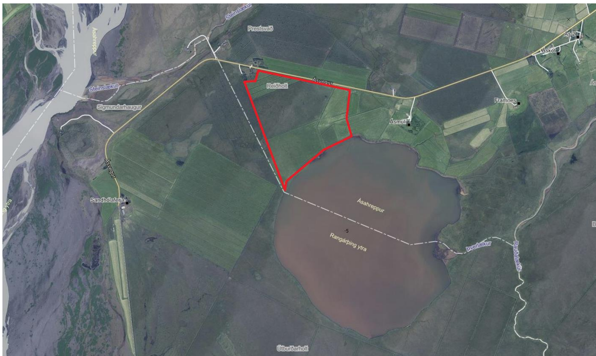
Mynd 1 Yfirlitsmynd af fyrirhuguðu skipulagssvæði

Samkvæmt vistgerðarkortlagningu NÍ er svæðið skilgreint sem tún og akurlendi, runnamýravist og hrossanálarvist. Einnig er svæðið innan skilgreinds VOT- S 3 Suðurlandsundirlendi – mikilvægt fuglaverndunarsvæði. En ekki er skilgreint votlendi innan skipulagssvæðis.