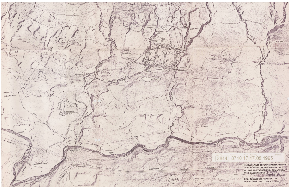
MYND 3 Deiliskipulag svæðisins frá 1995.

Skipulagið verður fellt úr gildi með gildistöku þessa skipulags.