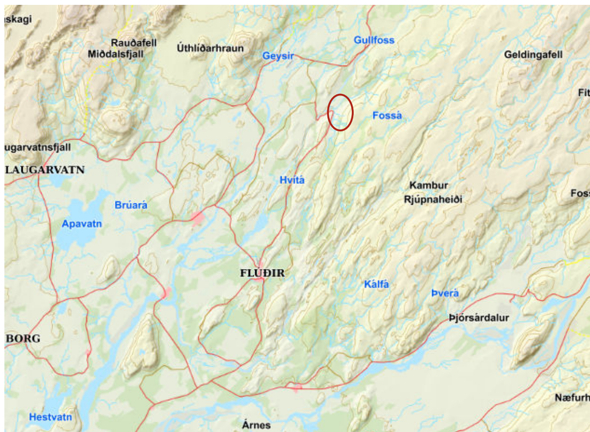
Mynd 1. Yfirlitskort, svæðið er afmarkað með rauðum hring.

Aðkoma að svæðinu er af Skeiða- og Hrunamannavegi (nr. 30), heimreið að Tungufelli/Jaðri (nr. 349) og slóða/vegi um svæðið.