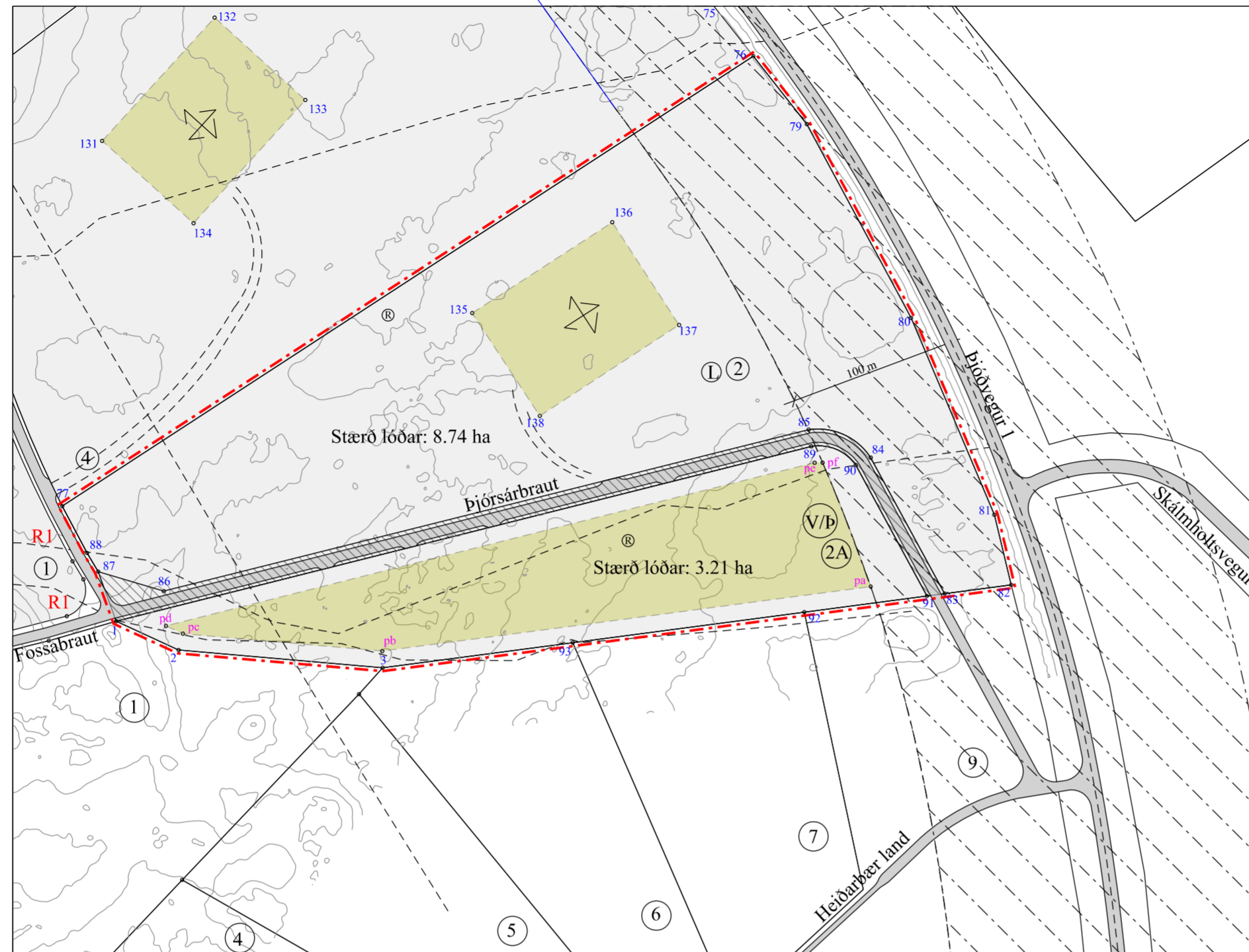
Deiliskipulag mkv. 1 : 3.000 (A2)