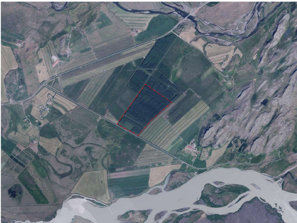
Mynd 1 : Staðsetning skipulagssvæðis innan Skeiða- og Gnúpverjahrepps

Í Aðalskipulagi Skeiða- og Gnúpverjahrepps 2017-2029 er landið sem Skógræktar- og Landgræðslusvæði. Ekki er í gildi deiliskipulag fyrir svæðið og er því um að ræða sameiginlega skipulagslýsingu fyrir aðalskipulagsbreytingu og nýtt deiliskipulag.