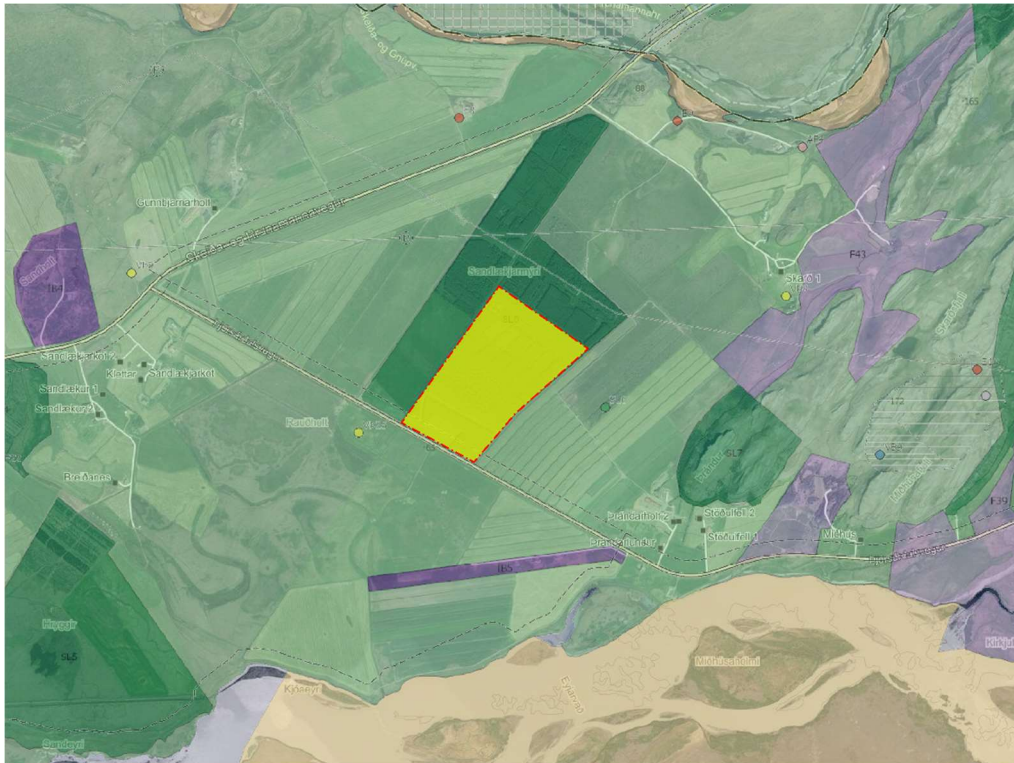
Mynd 3. Skýrimynd fyrir drög að aðalskipulagsbreytingu.

Megin markmið með aðalskipulagsbreytingunni er að skilgreina nýtt svæði fyrir Verslun og Þjónustu fyrir uppbyggingu á gistiþjónustu ferðamanna. Breytingin tekur til 40.4 hektara svæði sem er nú skilgreint sem Skógræktarsvæði en verður skilgreint sem svæði fyrir Verslun og Þjónustu.