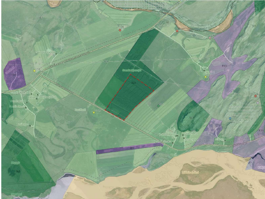
Mynd 2. Staðsetning skipulagssvæðis á uppdrætti núgildandi aðalskipulags Skeiða- og Gnúpverjahrepps 2017-2029.

Sýndur Þjórárdalsvegur á suðurhlíð skipulagssvæðis. Engar slóðir eða gönguleiðir liggja í gegnum svæðið. Svæðið er ekki innan verndarsvæðis skv. gildandi aðalskipulagi.