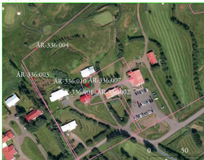
mynd 1. Skráðar minjar í og við bæjarstæði Efra-Sels skv. aðalskráningu fornminja í Hrunamannahreppi.

Engar skráðar náttúruminjar eru innan skipulagssvæðisins og gerði Minjastofnun Íslands enga athugasemd við skipulagslýsingu breytingarinnar. Fyrir liggur Aðalskráning fornminja í Hrunamannahreppi, Áfangaskýrsla I FORNLEIFASTOFNUN ÍSLANDS SES, REYKJAVÍK 2020 FS779-17101 og þar koma fram nokkrar minjar í tengslum við bæjarstæði Efra Sels. Við endurskoðun deiliskipulags þarf að færa þær minjar inn á uppdrátt. Samkvæmt þeim drögum sem þegar liggja fyrir í deiliskipulagi liggja minjarnar vel utan við fyrirhugað framkvæmdasvæði af því sem best verður séð.