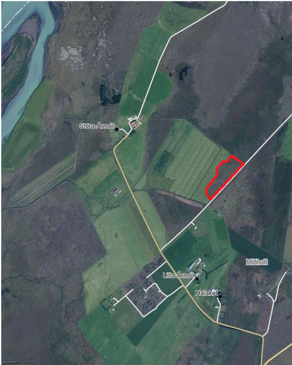
MYND 1 Yfirlitsmynd af fyrirhuguðu skipulagssvæði. Merkt með rauðu.