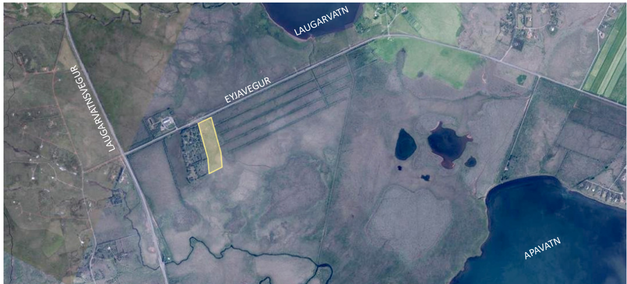
Mynd 1: Yfirlit yfir skipulagssvæðið. Gult sýnir umrætt svæði fyrir verslun- og þjónustu.

Ekki er í gildi deiliskipulag fyrir svæðið og er því um að ræða sameiginlega skipulagslýsingu fyrir aðalskipulagsbreytingu og nýtt deiliskipulag.