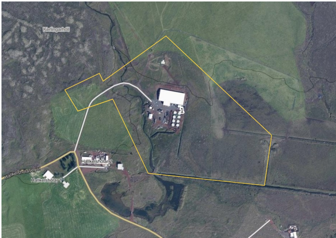
Mynd 1 Yfirlitsmynd af skipulagssvæðinu

Aðkoma er af Biskupstungnabraut (35), upp Búrfellsveg (351) og um heimreið Hallkelshóla. Eldisstöðin er staðsett á landbúnaðarlandi í Grímsnesi og er umliggjandi svæði ýmist landbúnaðarland eða frístundabyggð. Hallkelshólar eru í um 2 km fjarlægð norðan við Biskupstungnabraut og tæpum 4 km frá þéttbýliskjarnanum Borg í Grímsnesi.