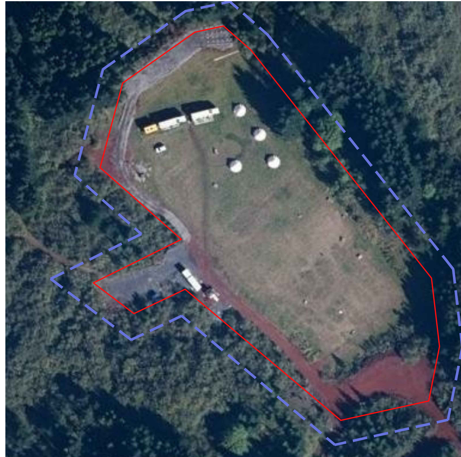
Núverandi ástand - loftmynd MKV:1:1000