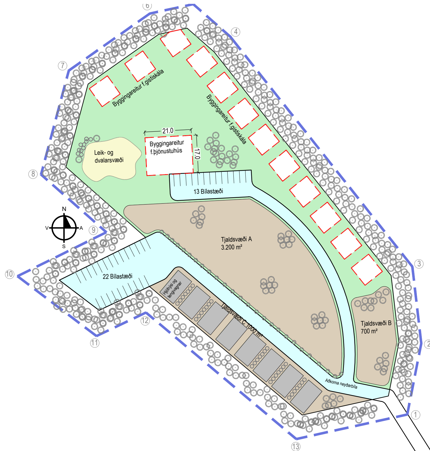
Tillaga að nýju deiliskipulagi MKV:1:1000