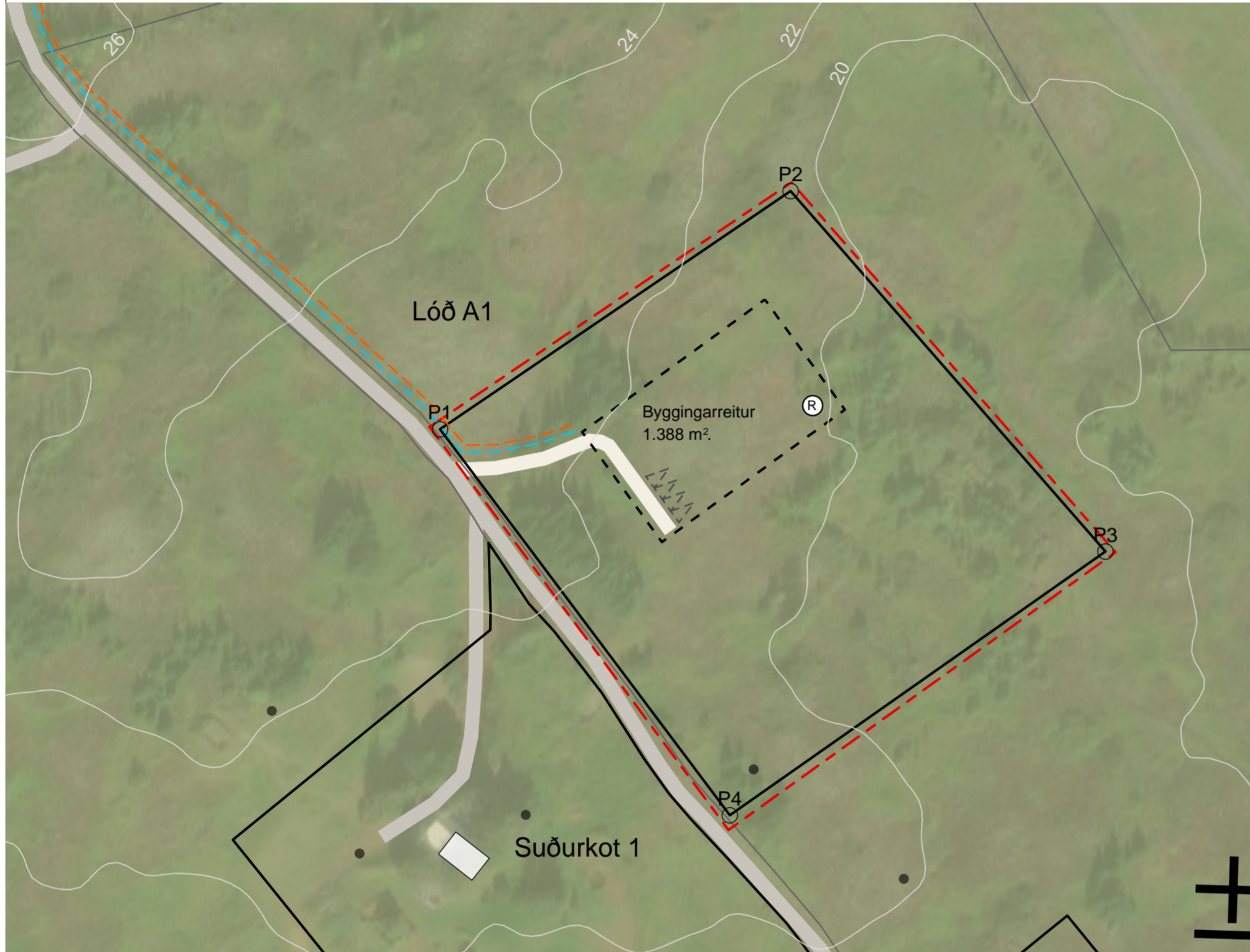
Deiliskipulagsuppráttur, mkv.: 1:1.000