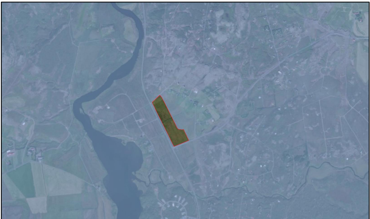
Mynd 1: Skipulagssvæðið sýnt á loftmynd.

Svæðið hefur verið skipulagt sem frístundabyggð með þjónustulóð við gatnamót þingvallarveggar og Búrfellsveggar, en skv. síðustu endurskoðun aðalskipulags er skipulagssvæðið á landbúnaðarlandi, þrátt fyrir að þar séu skipulagðar frístundalóðir.