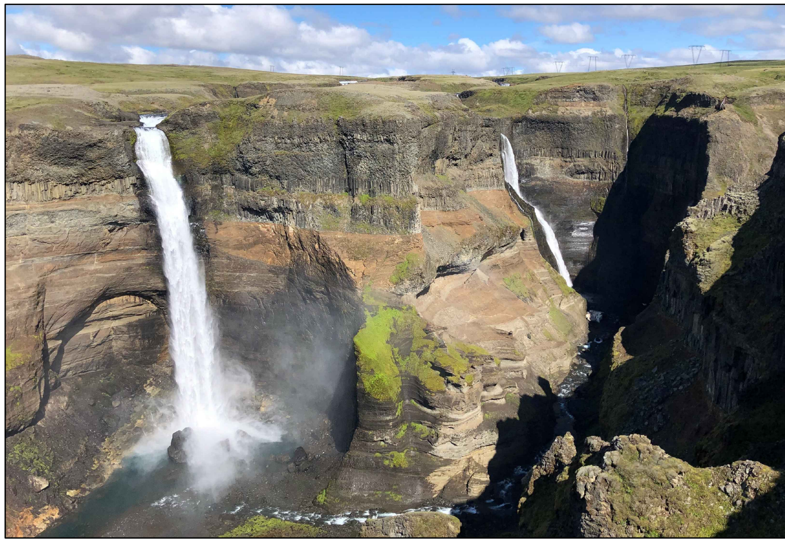
Háifoss og Granni - Mynd: Umhverfisstofnun