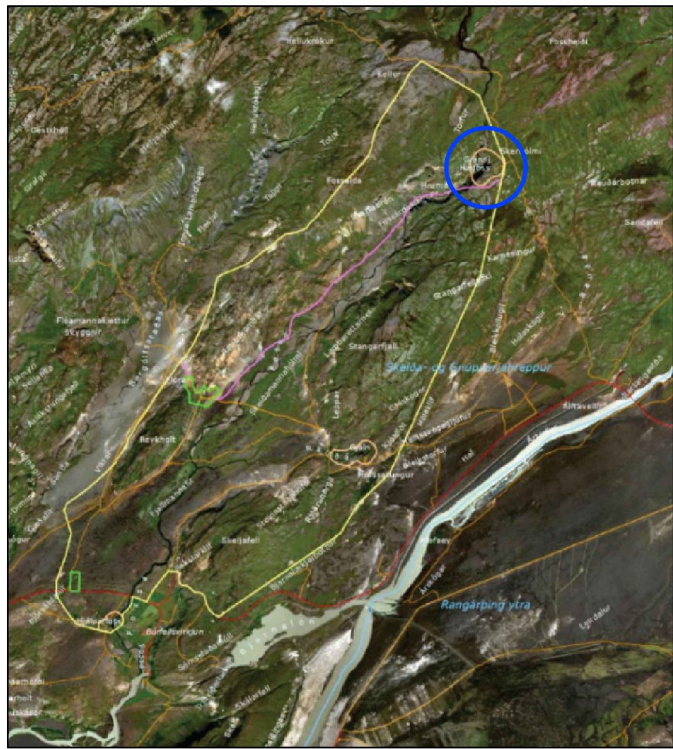
YFIRLITSMYND 3 - Ekki í kvarða Mörk fríðlýsts landslagsverndarsvæðis.