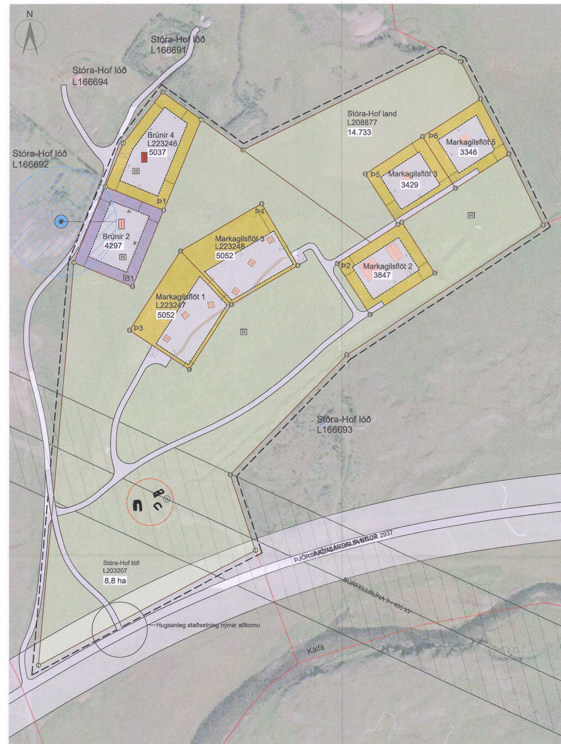
GILDANDI SKIPULAG - UPPDRÁTTUR 1:2000