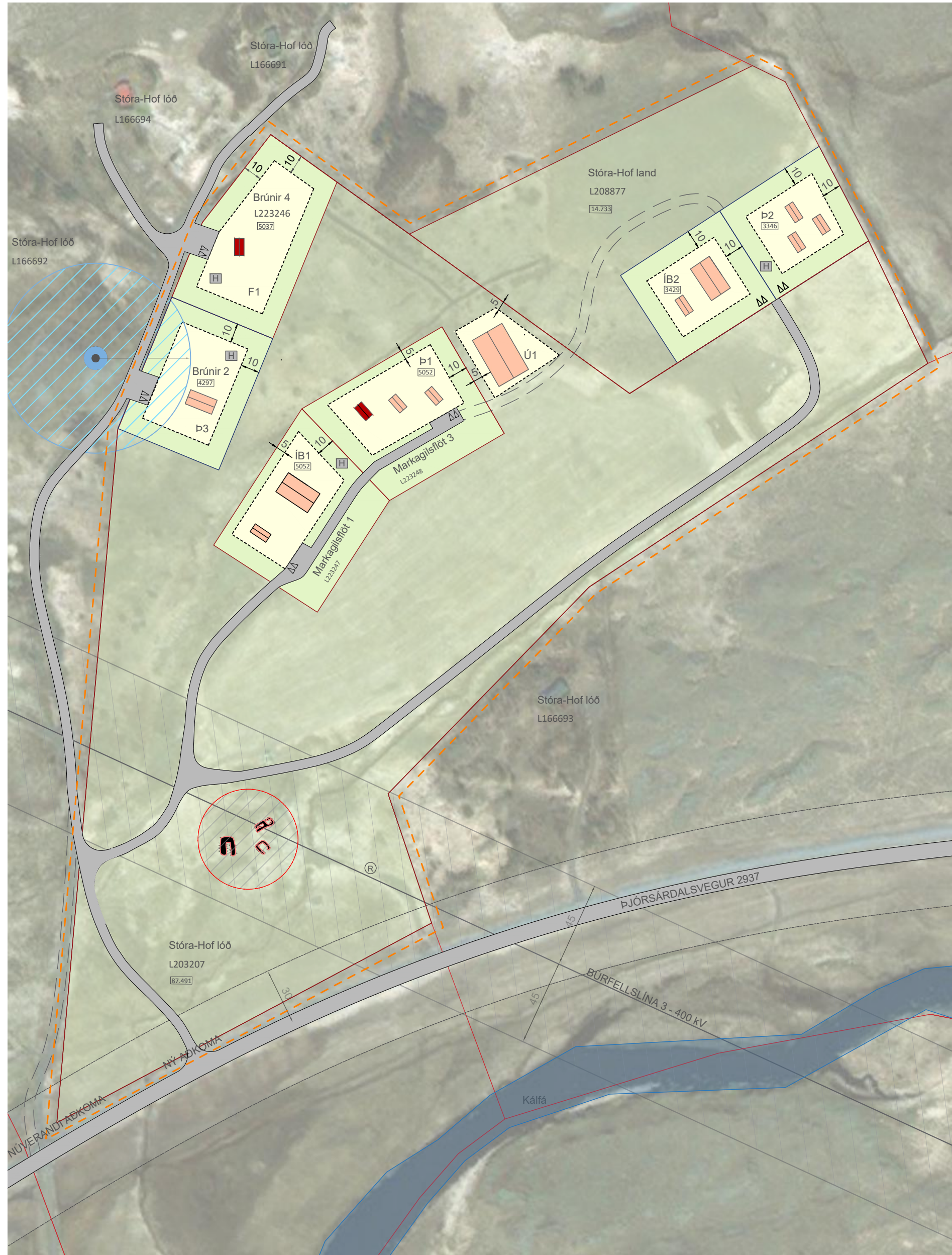
BREYTT DEILISKIPULAG - UPPDRÁTTUR 1:2000