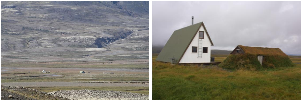
MYND 1. Á mynd til vinstri er horft yfir Svínarnes. Á mynd til hægri er skáli sem byggður var 1970 og gamall skáli frá 1960.

Svæðið er gróið og skv. vistgerðarkortlagningu Náttúrufræðistofnunar eru þar vistlendi mólendi og moslendi. Vistgerðir eru starmóavist, melagambravist, hélumosavist, hraungambravist og víðikjarrvist.