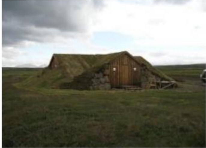
MYND 1. Skálinn í Fossilæk.

gerði fyrir hesta. Einnig er um 14 m 2 geymsla byggð árið 2009. Vatn er tekið úr læk nokkru norðan við húsið. Starfsemi er aðallega yfir sumartímann. Mannvirki eru í eigu Hrunamannahrepps. Staðurinn er í um 460 m h.y.s.