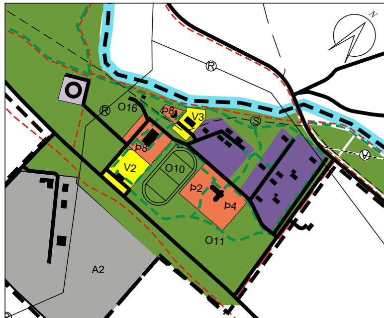
Aðalskipulag Skeiða- og Gnúpverjahrepps 2004-16, þéttbýli Árnæs - mkv. 1:10.000 - tillaga að breytingu