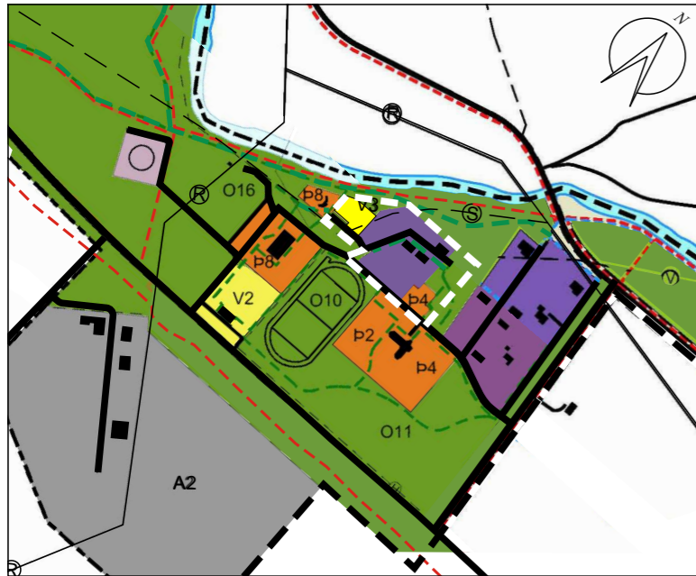
Staðfest Aðalskipulag Skeiða- og Gnúpverjahrepps 2004-16, þéttbýli Árnæs - mkv. 1:10.000 - fyrir breytingu