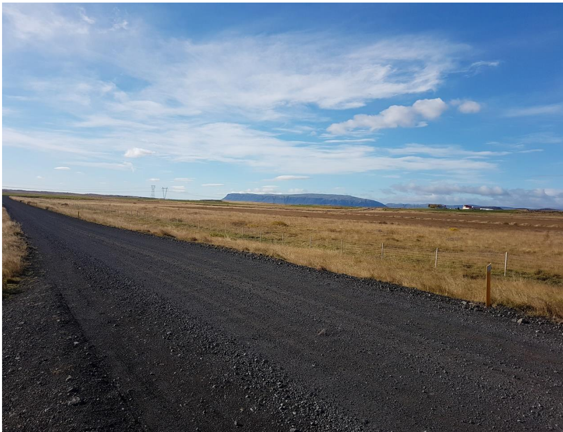
Mynd 2. Séð í suðvestur yfir væntanlegt skipulagssvæði.

Fornleifar - Minjastofnun Íslands verður sendur uppdráttur af skipulagssvæðinu og óskað eftir umsögn stofnunarinnar um væntanlegar framkvæmdir.