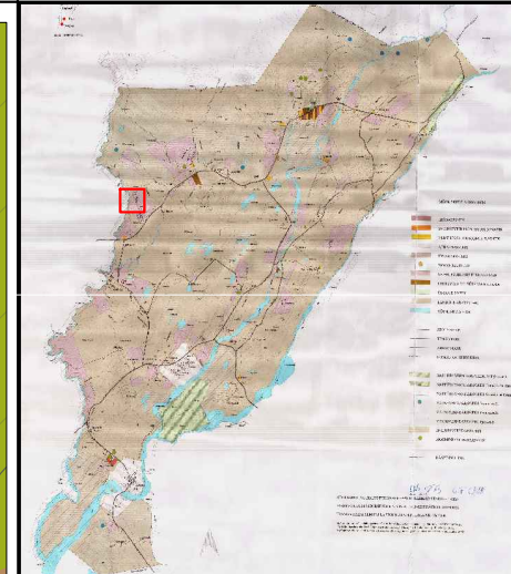
Afmörkun skipulagssvæðis í gildandi aðalskipulagi Bláskógabyggðar - Ekki í kvarða.