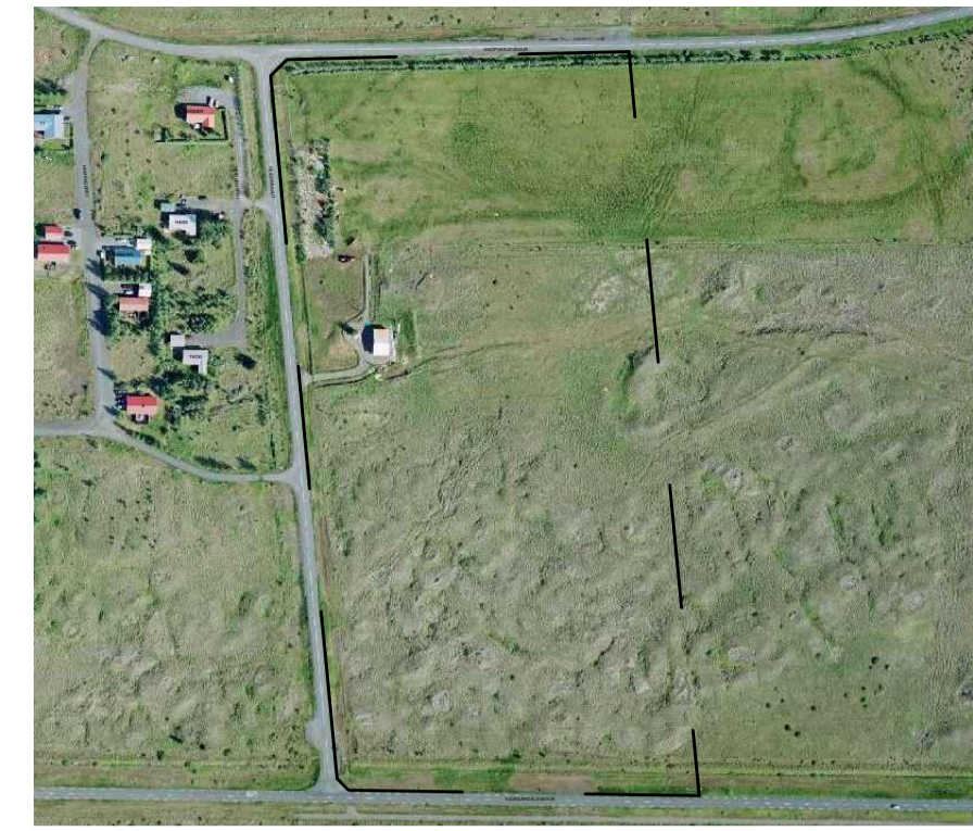
YFIRLITSMYND MKV. 1:5000