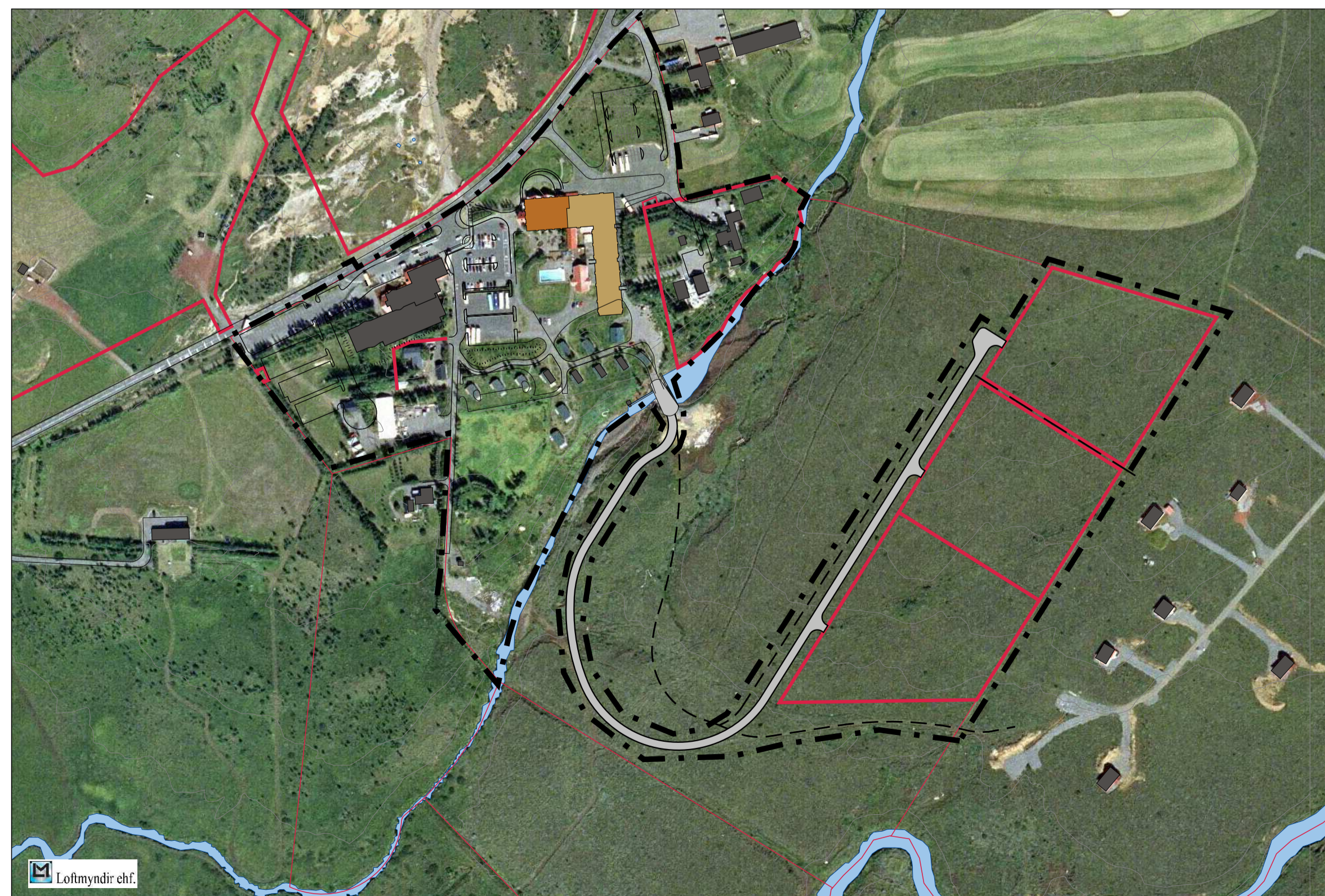
Skýringamynd í mkv. 1:5000