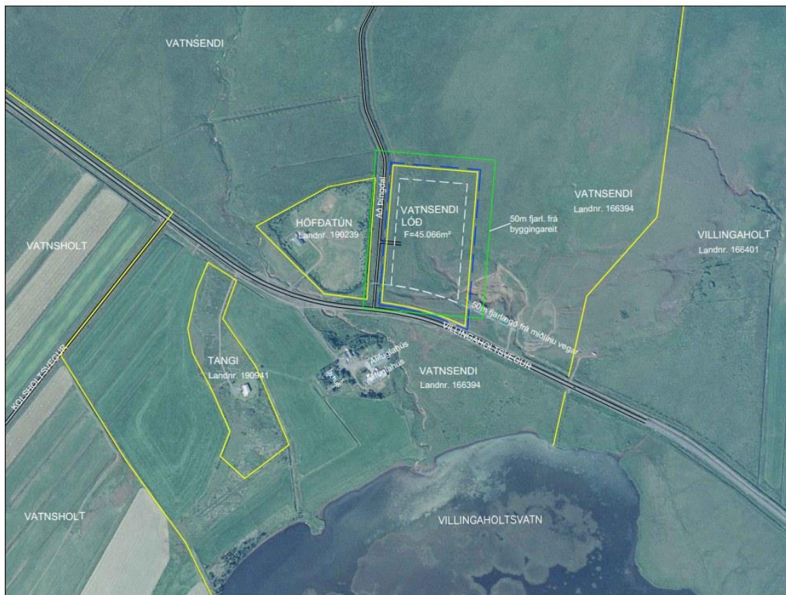
Mynd 1. Yfirlitsmynd af væntanlegu skipulagssvæði og nágrenni.

Á nýrri lóð sem stofnuð verður úr jörðinni Vatnsenda og deiliskipulagstillagan nær til eru engin mannvirki fyrir. Fyrirhugað skipulagssvæði er norðan Villingaholtsvegur nr. 305, gegnt bæjarhlaðinu að Vatnsenda. Á skipulagssvæðinu er fyrirhuguð bygging 6 alifuglahúsa. Aðkoma er frá Villingaholtsvegi um aðkomuvegi að Þingdal. Sunnan Villingaholtsvegur, á bæjarhlaðinu í Vatnsenda, stendur núverandi húsakostur alifuglabúsins. Á meðfylgjandi mynd sést skipulagssvæðið (blá brotalína), afmörkun nýrrar lóðar (gul lína) ásamt byggingareit (hvít brotalína) vegna væntanlegra bygginga. Þá eru einnig sýnd 50m fjarlægðarmörk frá byggingareit samkvæmt reglugerð nr. 520/2015 um eldihús alifugla, loðdýra og svína (græn lína) auk 50m fjarlægðar frá vegi samkvæmt skipulagsreglugerð nr. 90/2013 (ljósblá brotalína).