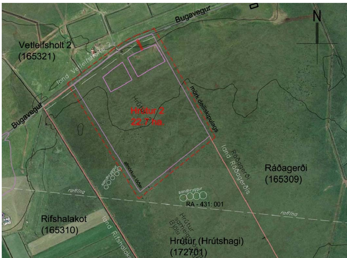
Tillaga að deiliskipulagi á spildunni Hrútur 2